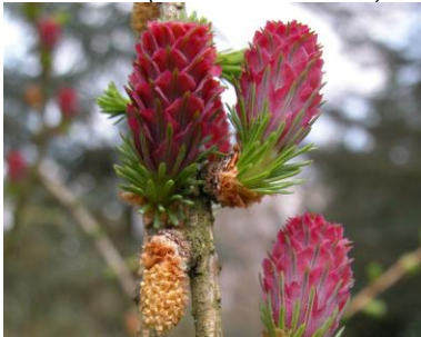
Europäische Lärche ( Larix decidua )