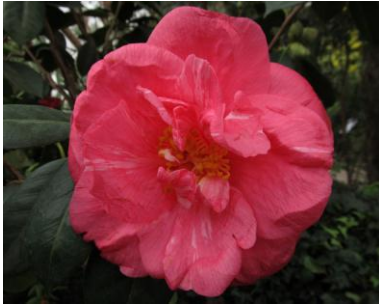
Camellia japonica 'Drama Girl'