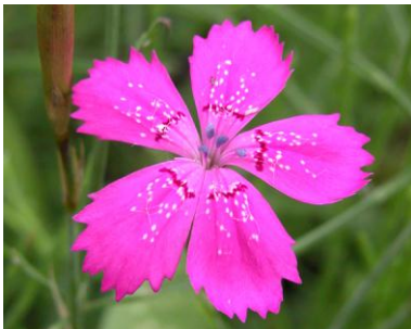
Heidenelke ( Dianthus deltooides )