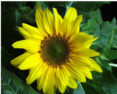
Sonnenblume ( Helianthus annuus )